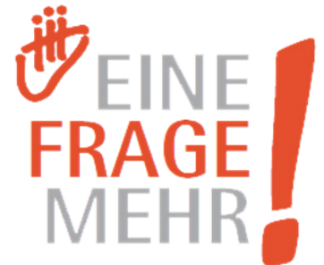
photo d'eux tenant un panneau « Nous posons la question ! ». Ils peuvent envoyer leurs photos numériques sur le site web de la campagne à l'adresse suivante : www.einefragemehr.de . En outre, des équipes armées d'appareils photos se rendront individuellement dans des congrès médicaux, des cliniques et des cabinets de médecins pour prendre d'autres clichés.

et des modules d'informations ciblés seront distribués aux médecins, aux patients et aux hommes politiques. Des publicités dans les journaux et des annonces dans les médias demanderont aux médecins et au personnel médical dans toute l'Allemagne de se lever et de joindre leurs efforts à la campagne « Juste une question » ! Les médecins et leurs équipes peuvent le faire en postant une